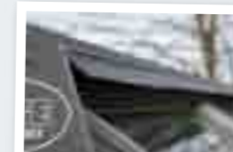
ЗАГЛУШКИ НА КОНЕК