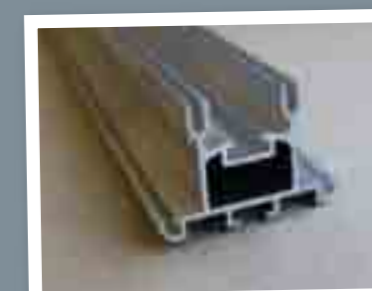
УСИЛЕННЫЕ ПРОФИЛИ CORE-VECT

Прежде чем сделаете окончательный выбор, сравните применяемые профили и убедитесь в превосходстве усиленных профилей Core-Vect