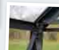
УСИЛЕНИЯ В УГЛАХ