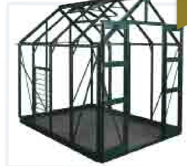
Модель Титан/Titan 2.5x2.0м, двойная дверь, интегрированная база, закаленные стекла

В стандартную комплектацию входят двойные двери, низкий порог, 10-полосные жалюзи, распорки. Теплица может быть как неокрашенной, так и любой из трех представленных цветов. А набор разнообразных аксессуаров делают эту модель еще более привлекательной.